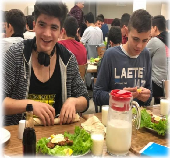
ÇİĞ KÖFTE ETKİNLİĞİ