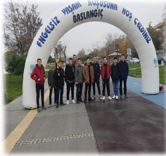
ENGELSİZ KOŞUYA KATILIM